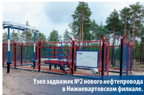
Узел задвижек №2 нового нефтепровода в Нижневартовском филиале.

транспортировки нефти с месторождения Варьеганской группы, очень долго создавала нам сложности. Старый коллектор построили больше 45 лет назад. Его дальнейшее использование несло в себе много серьезных рисков. Помню, когда мы рассматривали первые варианты модернизации этой системы, получались нереально высокие цифры затрат, такие, что собственными силами мы могли не справиться. Специалисты производственного блока совместно с коллегами из Радужного нашли отличное решение: развернуть направление транспортировки нефти, что позволило значительно сократить протяженность трубопровода и использовать объекты инфраструктуры предприятия «Аганнефтегазгеология», находящиеся в хорошем состоянии. Это дало колоссальную экономию средств и времени.