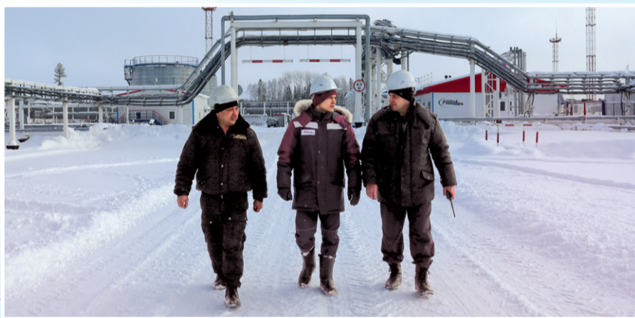
На Верхне-Шапшинском месторождении произошло много значимых событий. Компания вела здесь бурение, построила социально-бытовой комплекс. В следующем году Ханты-Мансийский филиал сосредоточит основные усилия на освоении Восточно-Каменного участка недр.