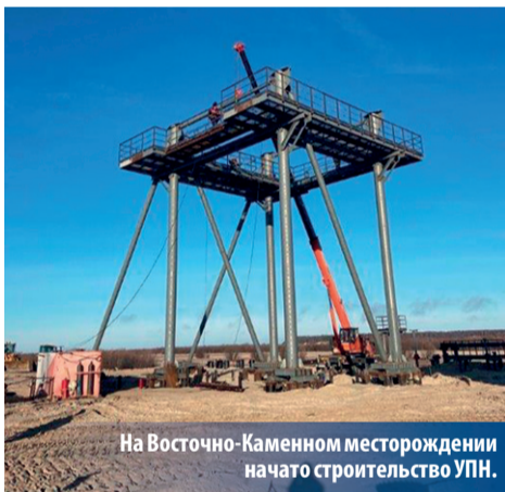
На Восточно-Каменном месторождении начато строительство УПН.

«В начале текущего года на нашем рынке сложилась тяжелая ситуация. В январе стал катастрофически быстро расти дисконт между ценами на нефть марок Brent и Urals, то есть стала падать цена, по которой мы отпускаем продукцию потребителям. Кроме того, заработали более строгие ограничения сделки ОПЕК+ на объем добычи. Кризисные процессы в макроэкономике вынудили нас экстренно переделывать бизнес-план и переходить к модели, способной выдержать стресс».