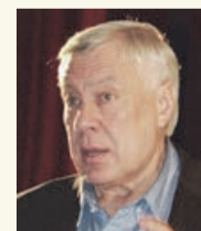
Александр Баландин, лётчик-космонавт, Герой Советского Союза:

и в дальнейшем успешно реализовывать все начинания, послужат примером для других предприятий отрасли.