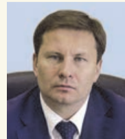
Вадим Ойкин, первый заместитель председателя Правительства области:

новые сложные задачи. Они по плечу нашему высокопрофессиональному, самоотверженному, дружному коллективу. Будем достойны наших предшественников. От всей души поздравляю вас, единомышленники и коллеги, с юбилеем предприятия, желаю ветеранам – здоровья, а молодым – терпения и оптимизма, веры в то, что все задуманное будет выполнено.