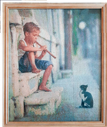
Концерт для кошки

Свободное время я стараюсь проводить с семьей. Люблю классическую музыку (в свое время окончила музыкальную школу по классу фортепиано), художественную литературу, рукоделие (вышиваю). Предлагаю вниманию читателей одну из своих работ.