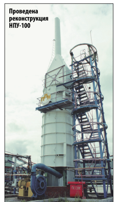
Проведена реконструкция НПУ-100