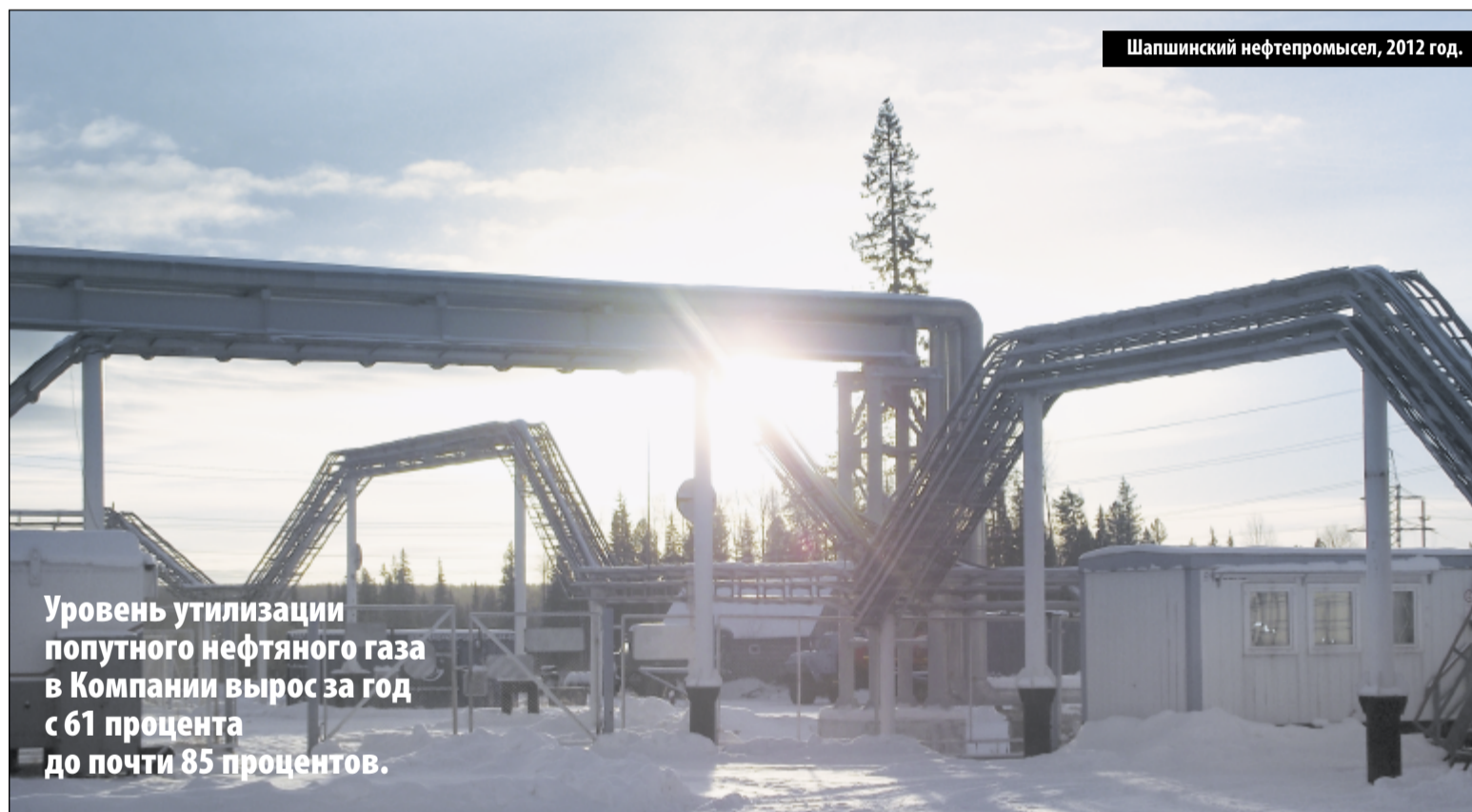
Шапшинский нефтепромысел, 2012 год.

Уровень утилизации попутного нефтяного газа в Компании вырос за год с 61 процента до почти 85 процентов.