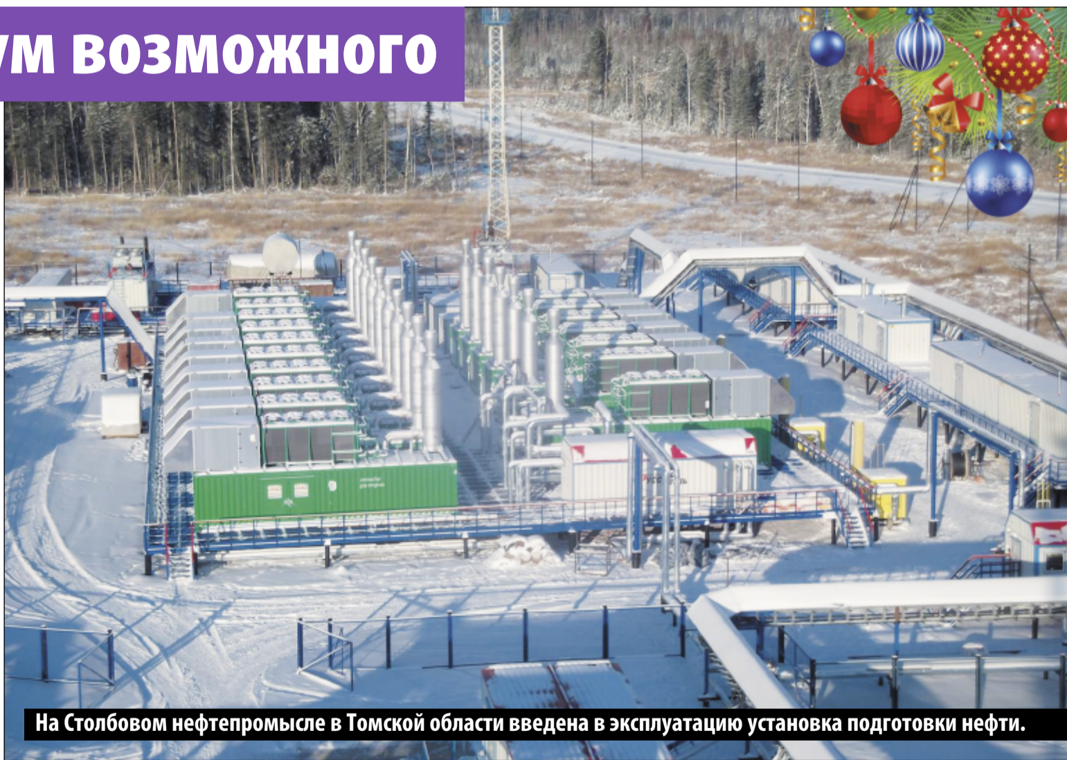
На Столбовом нефтепромысле в Томской области введена в эксплуатацию установка подготовки нефти.

– Добыча нефти, рост этого показателя у нефтяников всегда задача номер один. Но в текущем году приоритетной была и газовая программа. На этом направлении мы сделали максимум возможного. Сегодня практически на всех промыслах Компании установлены замерные устройства – таково требование надзорных органов. » 2