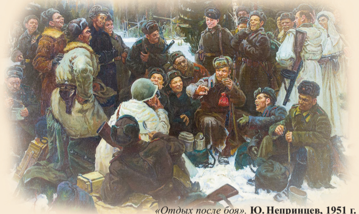
«Отдых после боя». Ю. Непринцев, 1951 г.

Малоизвестный факт: с 1941 по 1945 год в политуправлении Западного фронта издавался журнал «Фронтовой юмор». В нем публиковались фельетоны, частушки, пословицы и карикатуры. «Когда противник смешон, он не так страшен», – считали в редакции. Откроем желевшие страницы этого уникального издания.