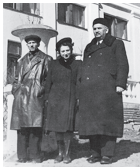
Дядя, мама и дед автора

Дедушка перед войной был заместителем директора хлебозавода. Когда в Москве было объявлено осадное положение, ряд предприятий заминировали и хотели взорвать. По словам нашего дачного знакомого, дед убедил пришедших сотрудников НКВД отложить их решение на том основании, что Сталин, дескать, не уехал из Москвы, столицу будут защищать. «Как увидим немцев, так завод и взорвем», – предложил дед. До уничтожения предприятия дело в итоге не дошло. Дед сознавал, что его сопротивление может выйти ему боком, но думал он в тот момент не о себе. Насколько мне известно, подобным образом спас от подрыва Шуховскую башню на Шаболовке руководитель телевизионной лаборатории.