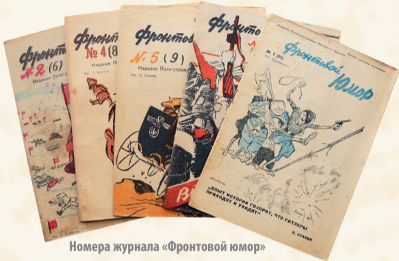
Номера журнала «Фронтовой юмор»

Малоизвестный факт: с 1941 по 1945 год в политуправлении Западного фронта издавался журнал «Фронтовой юмор». В нем публиковались фельетоны, частушки, пословицы и карикатуры. «Когда противник смешон, он не так страшен», – считали в редакции. Откроем желевшие страницы этого уникального издания.