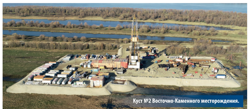
Куст №2 Восточно-Каменного месторождения.