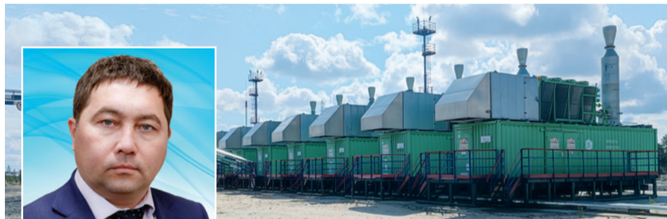
Рустем Ильясов, Нижневартровский филиал:

– На месторождениях нашего предприятия добыто 2363 тыс. тонн нефти, газа – 1517 млн куб. м, ГТМ на базовом фонде обеспечили добычу 239 тыс. тонн. На шести кустовых площадках построено 49 скважин с годовой добычей 346 тыс. тонн нефти.