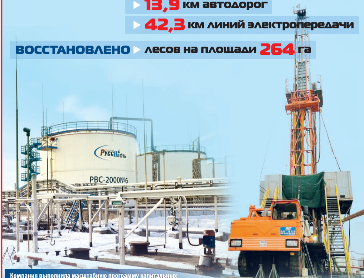
Компания выполнила масштабную программу капитальных вложений и подготовила хорошие заделы на 2025 год.