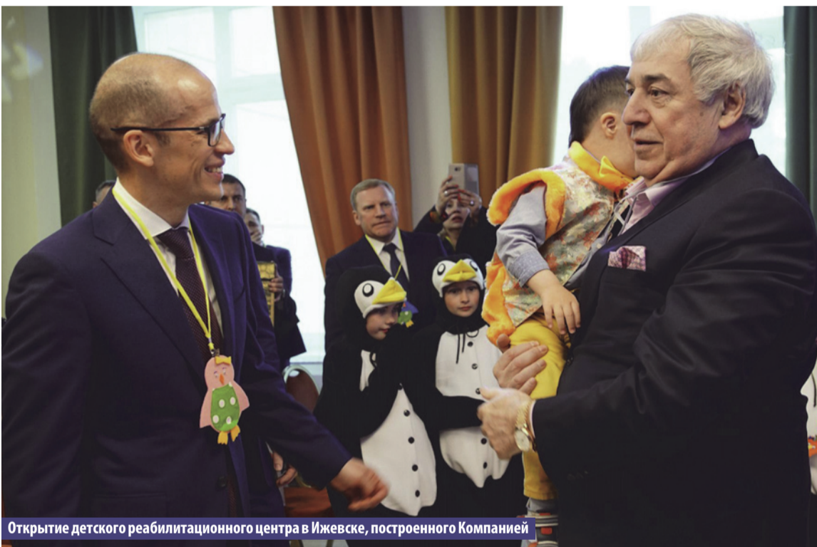
Открытие детского реабилитационного центра в Ижевске, построенного Компанией