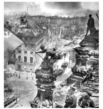
Этот знаменитый снимок Е.Халдея сделан через два дня после события.

На знаменитом снимке Евгения Халдея запечатлен момент водружения над рейхстагом «официального» знамени. Однако впоследствии военный фоторокор признался, что снимок – постановочный. На нем изображены не Егоров и Кантария и флаг не тот. Фотография еще и ретушировалась, поскольку редактор «Правды» разглядел на руке советского автоматчика пару трофейных часов... Съемка производилась 2 мая, местом действия избрали башню фронтона, поскольку купол рейхстага был обжат пламенем.