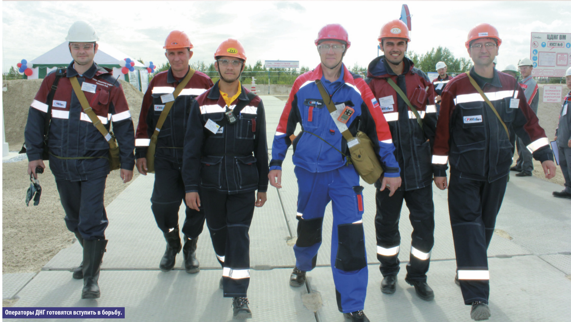
Операторы ДНГ готовятся вступить в борьбу.