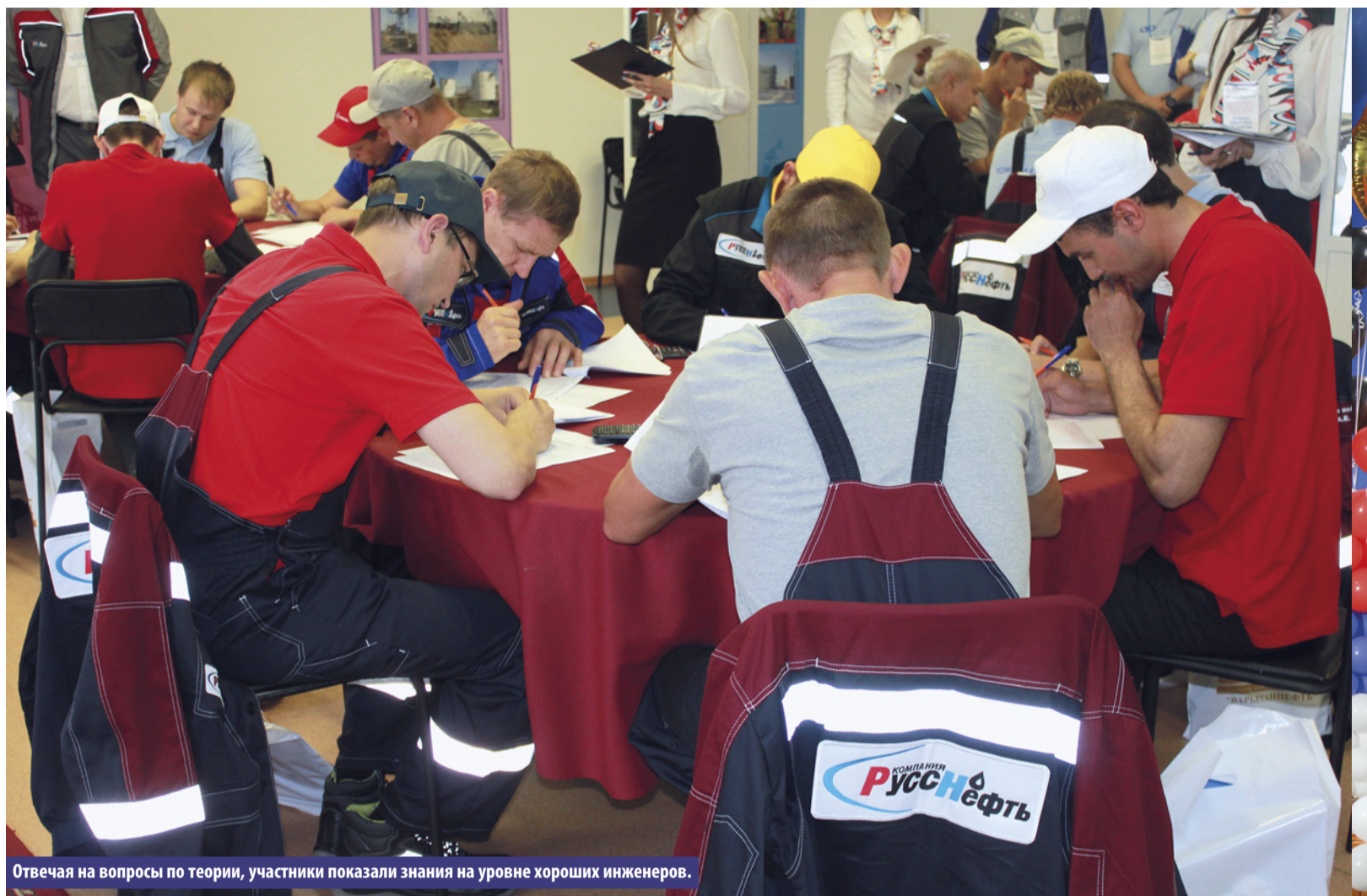
Отвечая на вопросы по теории, участники показали знания на уровне хороших инженеров.

Разговоры с конкурсантами оставляют очень хорошее впечатление. Все они, независимо от их возраста, – люди зрелые, сложившиеся, с твердыми представлениями о жизни. При этом – позитивные, всегда готовые улыбнуться, поддержать шутку. Пессимистов среди них не обнаружил ни одного. Иные и не