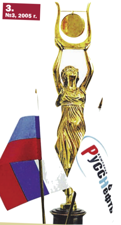
3. №3, 2005 г.