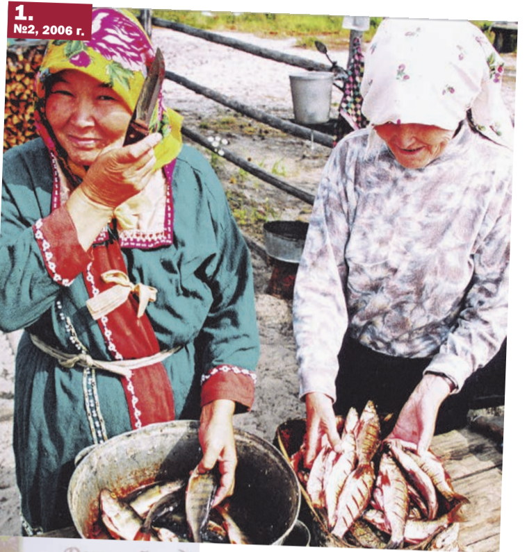
1. №2, 2006 г.

Каждая 50-я тонна нефти в стране добывается нашей компанией