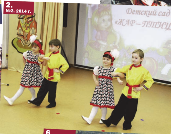
2. №2, 2014 г.