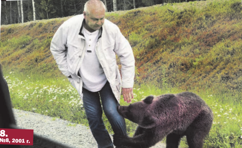
8. №8, 2001 г.