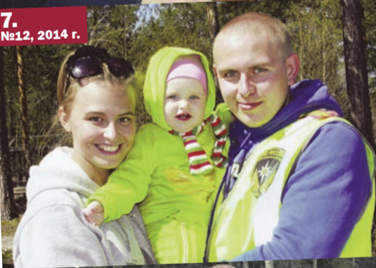
7. №12, 2014 г.