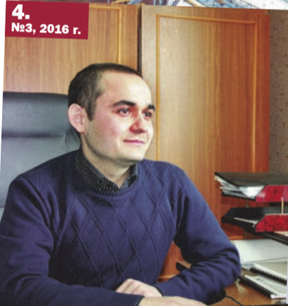
4. №3, 2016 г.