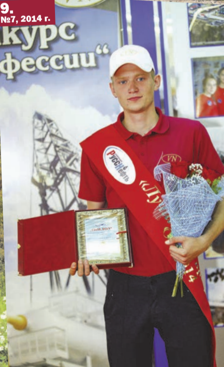
9. №7, 2014 г.