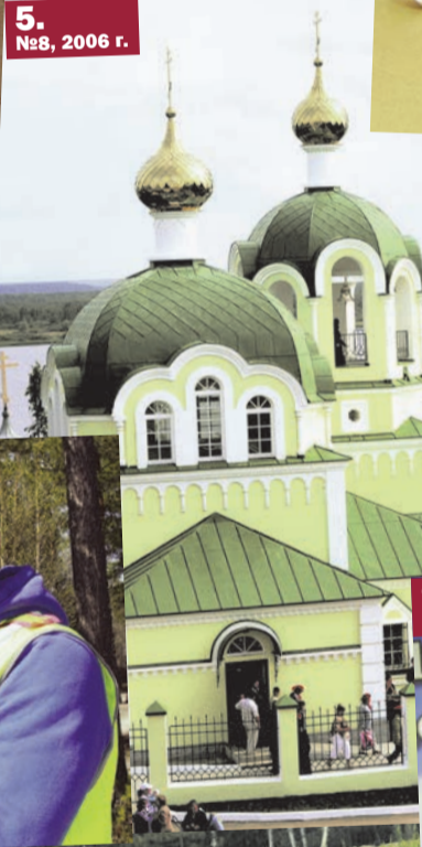
5. №8, 2006 г.