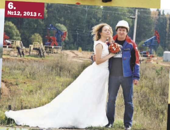
6. №12, 2013 г.