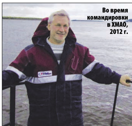
Во время командировки в ХМАО, 2012 г.

Традиции издания складывались постепенно. Их подсказывала сама жизнь. Весной 2004-го мы предложили сотрудникам Компании рассказать об их родственниках, приближавших Великую Победу – поток этих материалов не иссякает уже 13-й год. Специальный номер газеты выходит по случаю Дня нефтяника. Итоги каждого года мы подводим в новогоднем номере, который выходит на восьми полосах. В марте героинями наших публикаций становятся милые женщины... Праздничных выпусков в году могло бы быть больше, но это, конечно, лишнее. Главное для корпоративной газеты – делать нужное для Компании дело: распространять полезный производственный и организационный опыт, описывать новые технологии, сплачивать и информировать нефтяников из разных Обществ, расска-